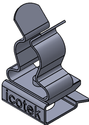
Klemmbreich: 10x3mm Sammelschiene