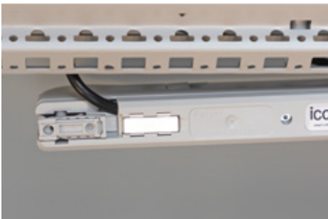
Montage mit integrierten Magneten