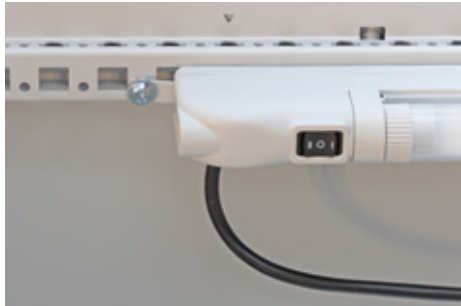
Assembly with screws on profiles and surfaces