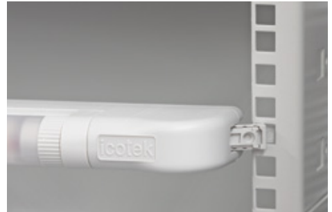
Snap-in assembly in the 19" rack