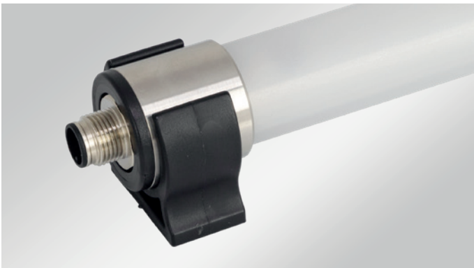
Befestigung mit Montageclips (im Lieferumfang enthalten)