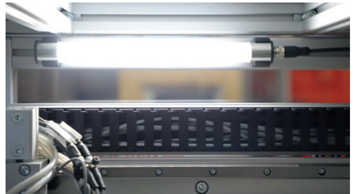
Assembly with mounting clips (included in the delivery)